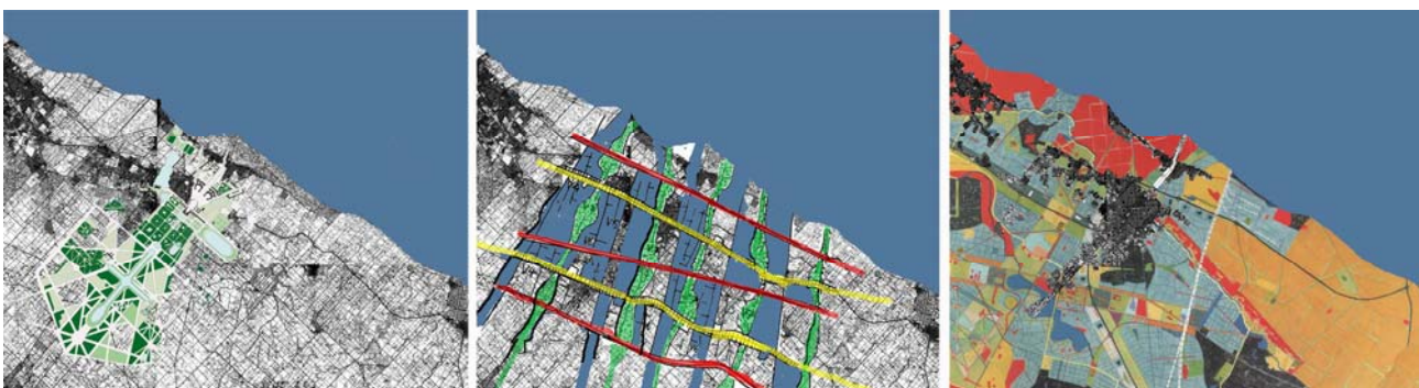
IMAGEN 5 Técnica de Superposiciones.

A través de la investigación proyectual utilizamos la técnica de superposición de modelos, alterando la escala de la intervención, donde los gráficos indican los grados de compatibilidad entre la mancha urbana existente y los modelos propuestos. (IMAGEN 5)